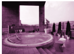
温泉アワー ※入浴料 男性800円 女性1,000円

今回は初日の講演会と夕食会の間に長めの休憩があります。この間、ホテル外の温泉施設「ナチュラルスパ宝塚」で温泉をお楽しみいただけるほか、様々な内容に応じて談話できるサロンを開催。それぞれご興味のある方々で交流・意見交換等をお楽しみいただけます。